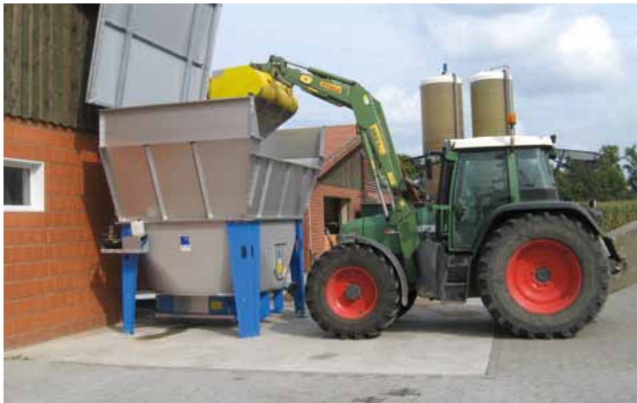
Dosierer Typ 200 mit 20 m 3 Lagervolumen, Entnahmeschnecke Typ 160 und hydraulisch betätigtem Deckel