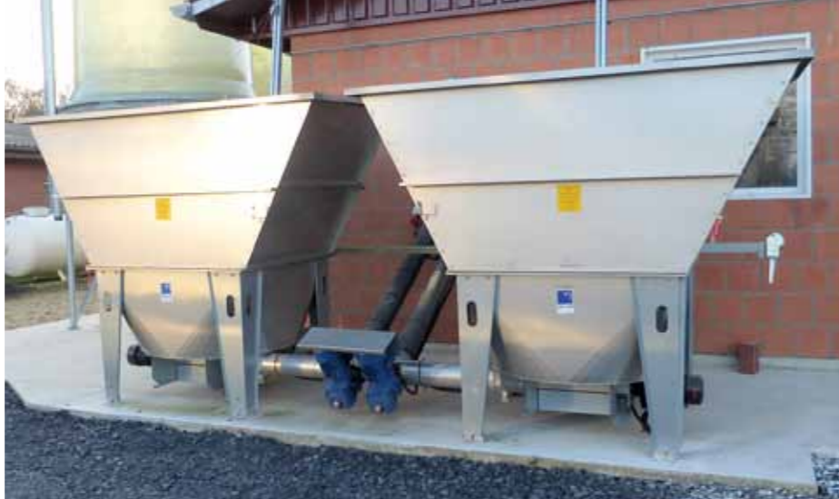
2 Stück UNI-Dos Typ 45 in Edelstahlausführung mit 3,2 m 3 Lagervolumen, Entnahmeschnecke Typ 160, Abdeckung aus Edelstahl mit Handkurbel